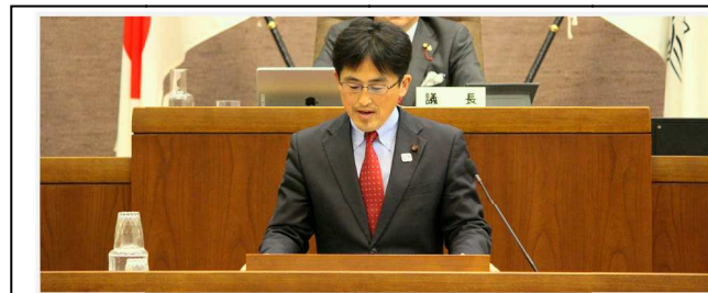
鎌倉市議会議員長嶋竜弘(完全無所属)