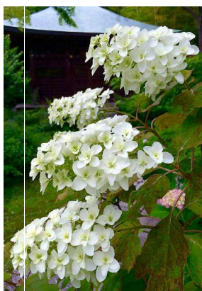
浄光明寺・柏葉紫陽花