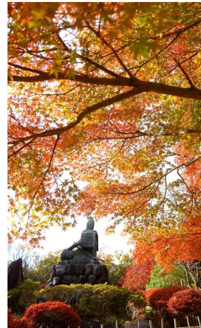
2021年12月1日源氏山頼朝像