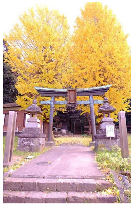
2015/12/10 諏訪神社(大船植木)