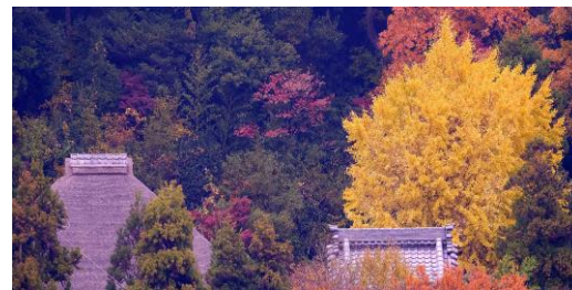
2015年12月10日撮影・杉本寺