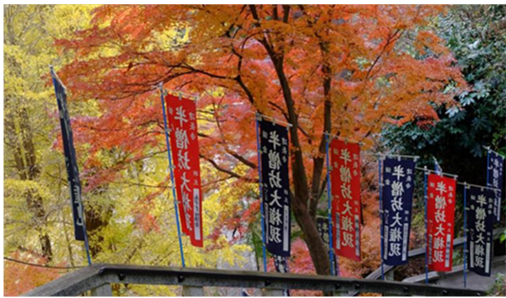
2020年12月16日撮影・建長寺半僧坊