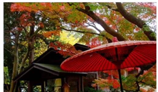
2021年12月1日撮影・鎌倉宮