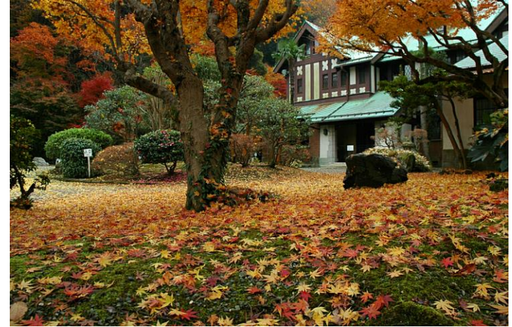
2017年12月1日撮影・華頂宮邸