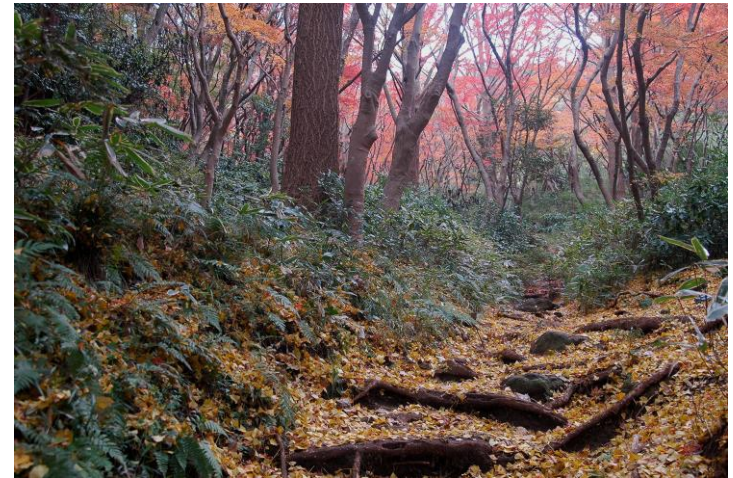
2008年12月8日撮影・獅子舞谷