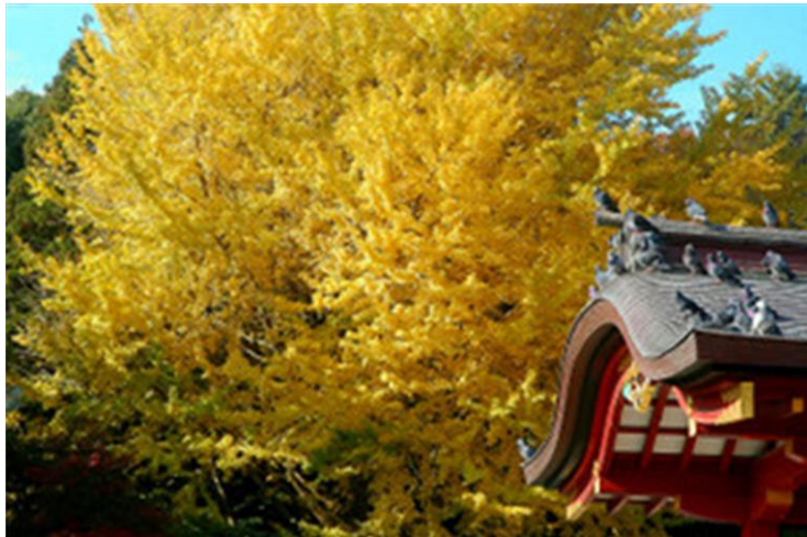
2008年12月1日撮影・鶴岡八幡宮