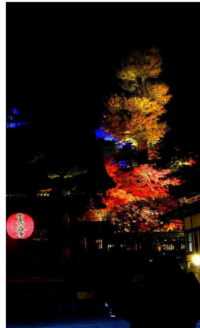
2015/12/10 長谷寺ライトアップ