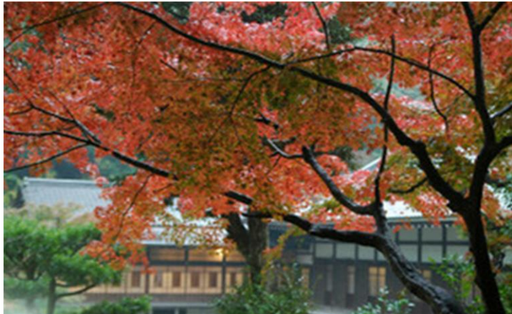
2008年11月24日撮影・円覚寺大方丈