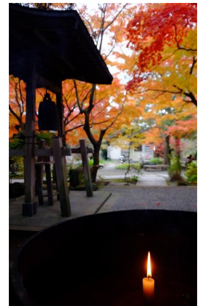
2017年12月1日撮影・覚園寺