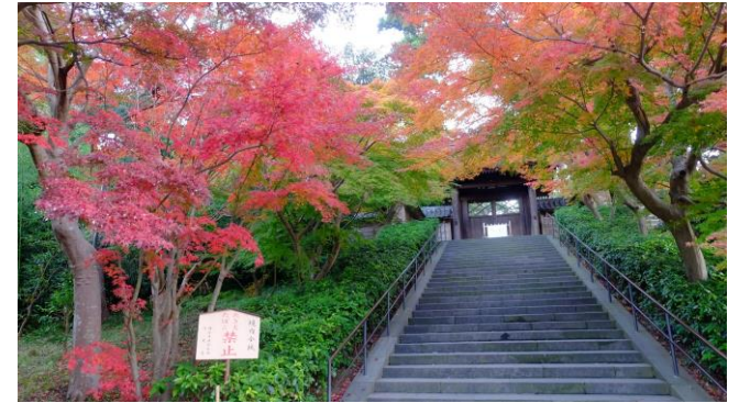
2024年12月3日撮影・円覚寺山門

鎌倉は紅葉のスポットは多数あり、近いお寺をいくつか合わせて散策すれば、それなりに満喫できると思います。場所によって1ヶ月程度見頃の時期がずれるので、QRのblog写真を見てチェックして下さい。