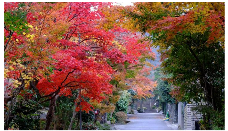
2017年12月1日撮影・海蔵寺参道